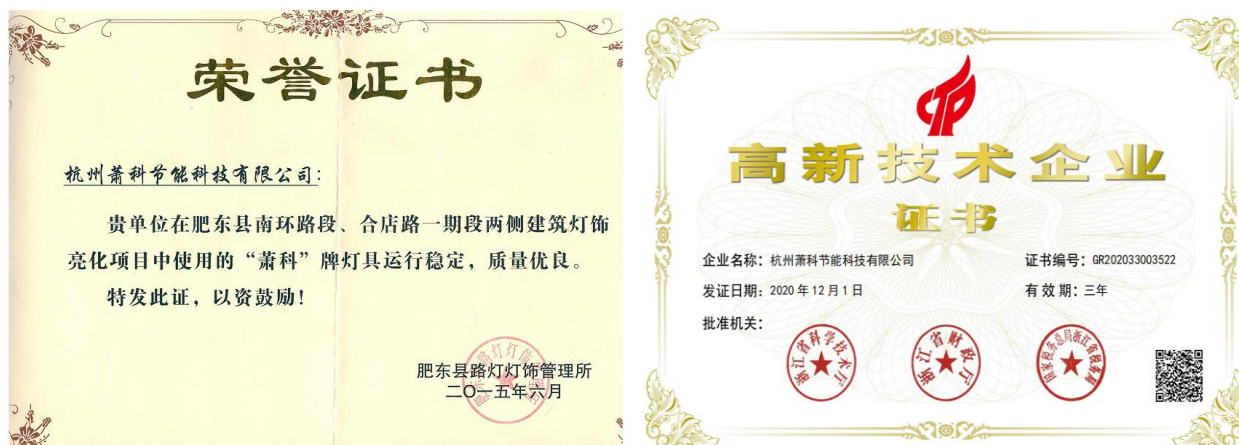
表3.3-2 公司诚信经营的成果

公司高层遵循“人无信不立，厂无信不存”的诚信共赢思想，从组织结构设计、工作流程优化、规章制度完善等方面为公司守法诚信经营创造了一个良好的环境，并在日常工作中带头践行。公司被授予杭州市高新技术企业、浙江省科技型中小企业、“萧科”牌灯具运行稳定，质量优良等荣誉，如图 3.3-1 所示：