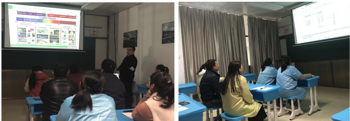
图 3.2-1 各类培训活动

公司将员工学习和发展视为“投资”，把创建学习型组织，营造全员学习的氛围作为公司长期发展战略的重要组成部分。随着公司规模扩大和全球化发展战略的实施，根据企业相关规定及各部门要求确定培训人员的需求情况。各部门负责人确定人员培训需求后经公司领导审批，相关部门每季度根据人员数量酌情进行培训计划的制定与实施。公司并成立了“萧科商学院”，见图 3.2-1 所示。